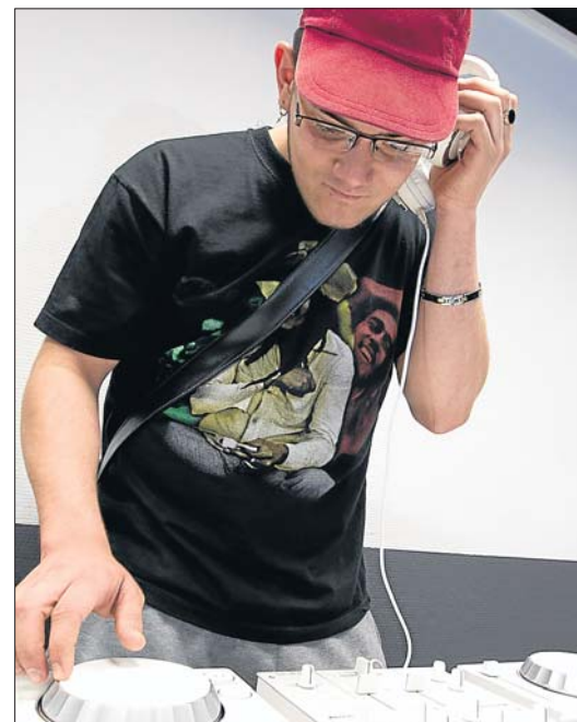
Auch für angehende DJs ist das neue Tonstudio im Jugendhaus geeignet.